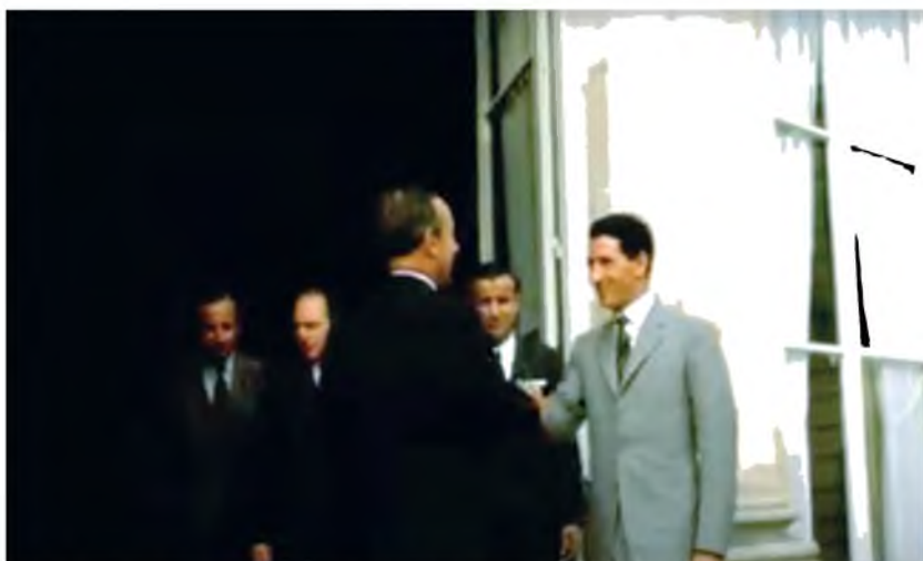
جانب من استقبال نائب الرئيس الليبي عبد السلام جلود في باريس من وزير الدفاع الفرنسي ميشيل دوبريه، فرنسا، 22/7/1971 .